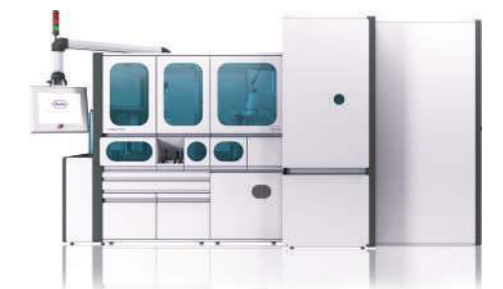
cobas p 501/p 701 njësi post-analitike Ruajtje frigoriferike