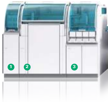
Stacioni i daljes