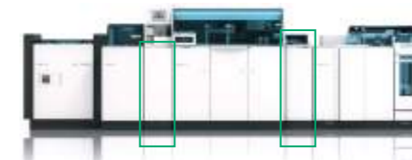
seria e analizatorëve modular cobas 8000 Modulët buffer të mostrave

Një zgjidhje me cobas 8100 ofron tre koncepte magazina, duke siguruar qasje të shpejtë automatike në mostrat sa herë që është e nevojshme.