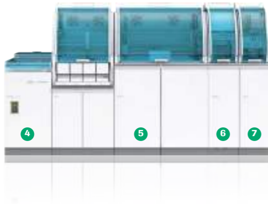
Stacioni i hyrjes